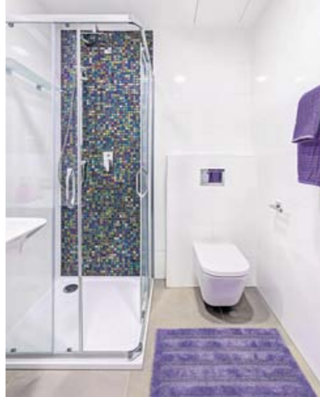
OŽIVENÁ KOUPELNA Developer zvolil ve standardu šedou dlažbu, lesklý obklad a kontrastní skleněnou mozaiku ve sprše.