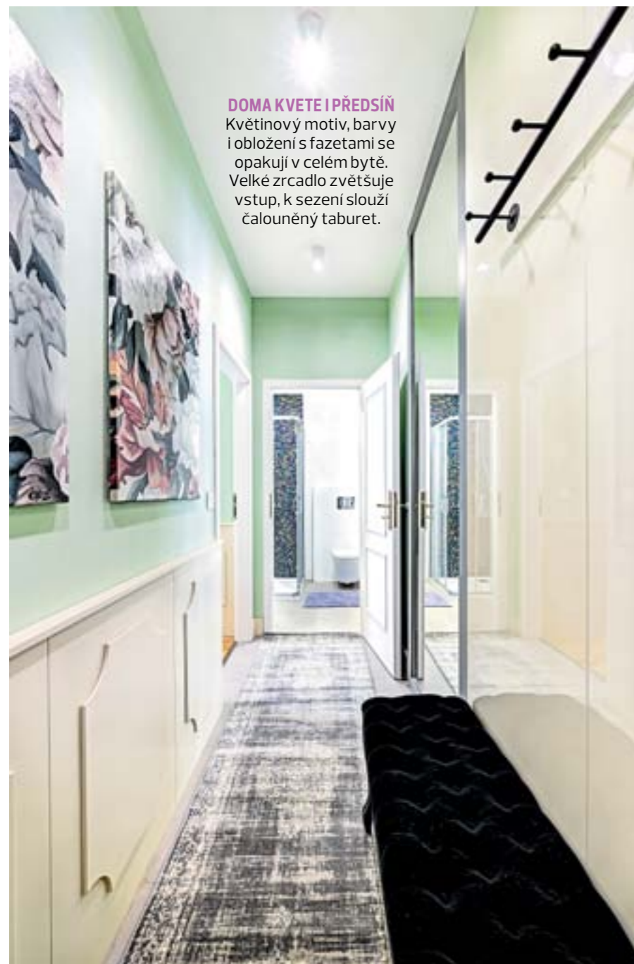
DOMA KVETE I PŘEDSÍN Květinový motiv, barvy i obložení s fazetami se opakují v celém bytě. Velké zrcadlo zvětšuje vstup, k sezení slouží čalouněný taburet.