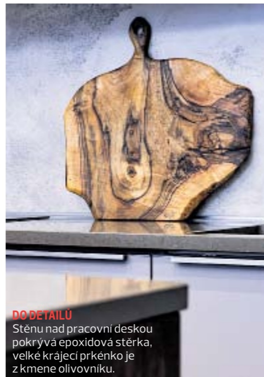
DO DETAILU Stěnu nad pracovní deskou pokrývá epoxidová stěrka, velké krájecí prkénko je z kmene olivovníku.

Kůže s patinou, kožešiny, sametové závěsy, tapeta s hadím vzorem, polštáře s gepardím. Na stěnách sloní dech, respektive odstín