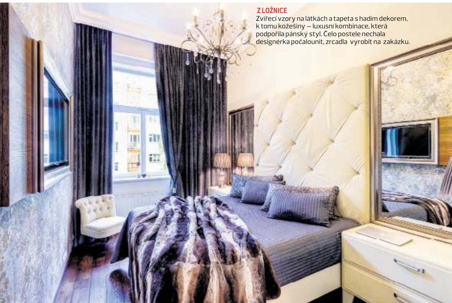
Z LOŽNICE Zvířecí vzory na látkách a tapeta s hadím dekorem, k tomu kožešiny – luxusní kombinace, která podpořila pánský styl. Čelo postele nechala designérka počalounit, zrcadla vyrobit na zakázku.