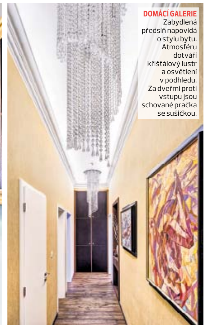
DOMÁCÍ GALERIE Zabydlená předstíň napovídá o stylu bytu. Atmosféru dotváří křišťálový lustr a osvětlení v podhledu. Za dveřmi proti vstupu jsou schované pračka se sušičkou.