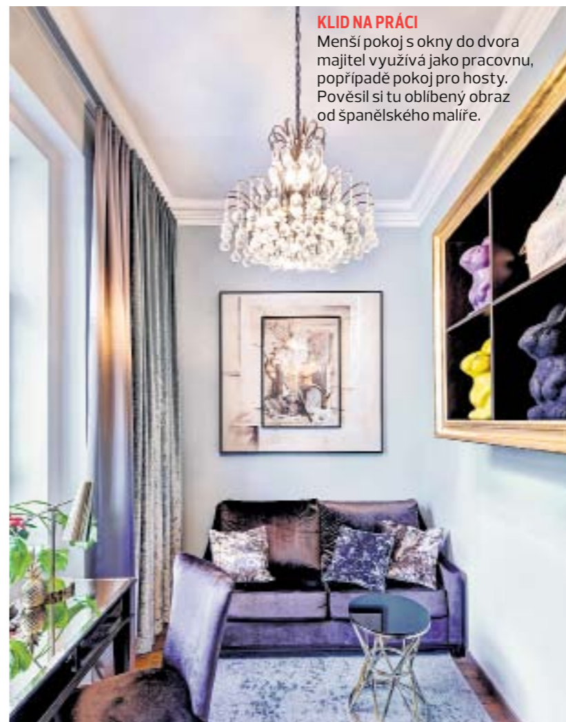
KLID NA PRÁCI Menší pokoj s okny do dvora majitel využívá jako pracovnu, popřípadě pokoj pro hosty. Pověsil si tu oblíbený obraz od španělského malíře.